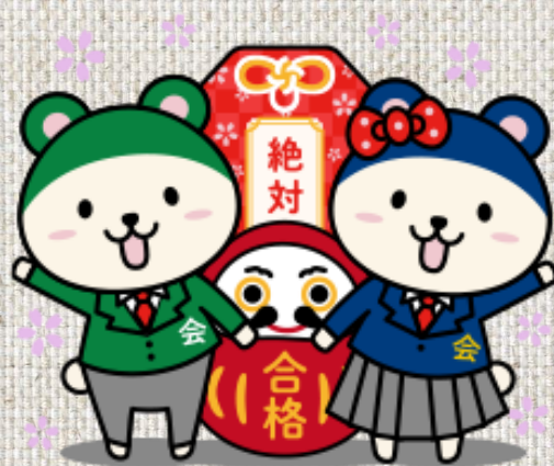
いちえくん いちごちゃん

⇒ ① 7/18(木) ② 7/25(木) ③ 8/1(木) ④ 8/8(木) ⑤ 8/15(木) ⑥ 8/22(木)